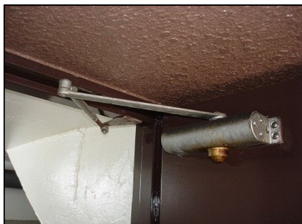
ドアクローザ交換後 油漏れで扉がきちんと閉まらない状態でした。