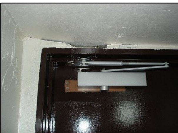
ドアクローザ取付後 扉がきちんと閉まると自動施錠される。