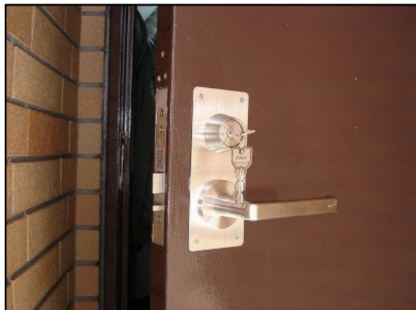
自動施錠錠取り付け後(外側) 扉が閉まると自動的に施錠される。