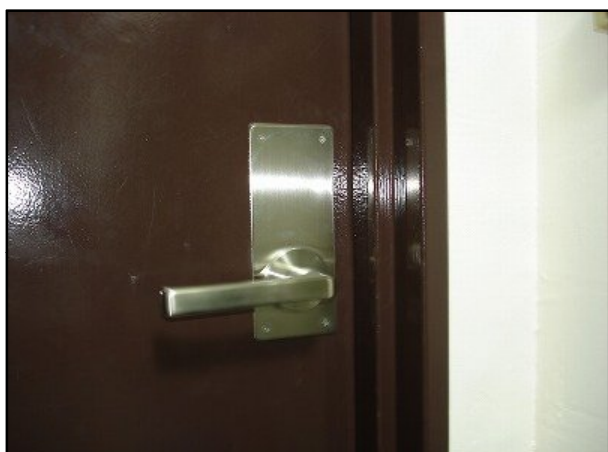
自動施錠錠取付後(室内側) 出るときはレバーハンドルを下げると解錠。