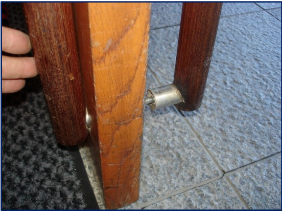
ドアハンドルのガタ付き発生で開閉が困難