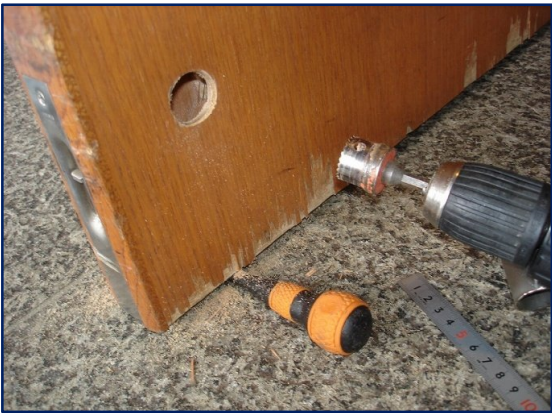
補強部品を付けるため下穴を広げている。