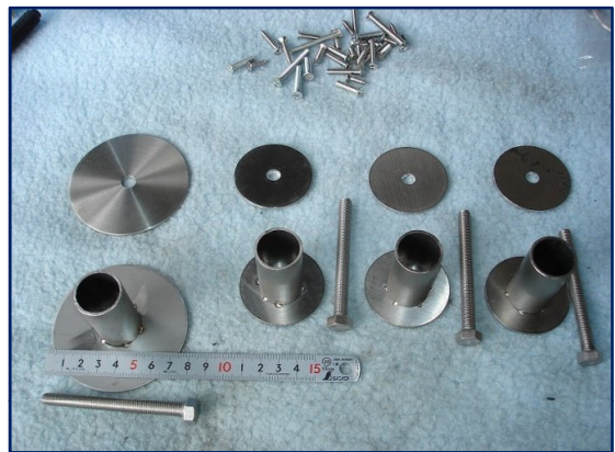
ドアハンドル補強のため特注製作品