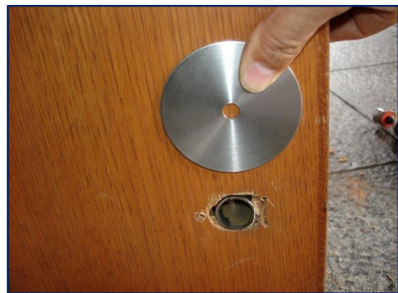
補強の丸パイプを通して補強。