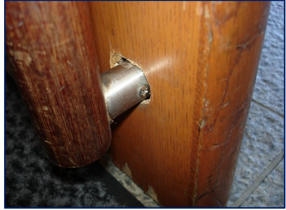
扉の中が空洞であるため、軸の処が陥没した状態。