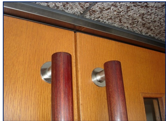
改修作業終了後(左右上下前後; 8ヶ所補強)