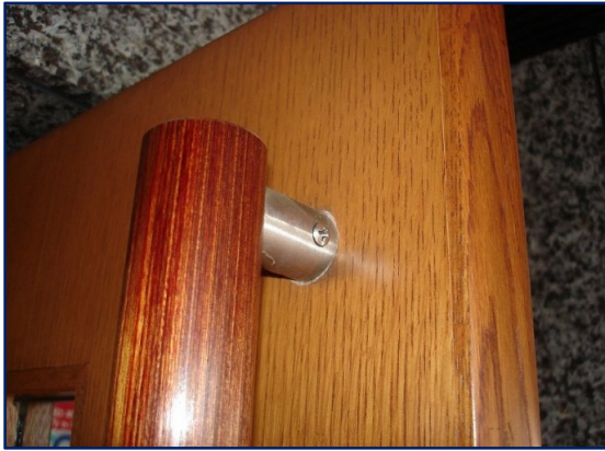
ドアハンドルが正常な状態(改修工事前)