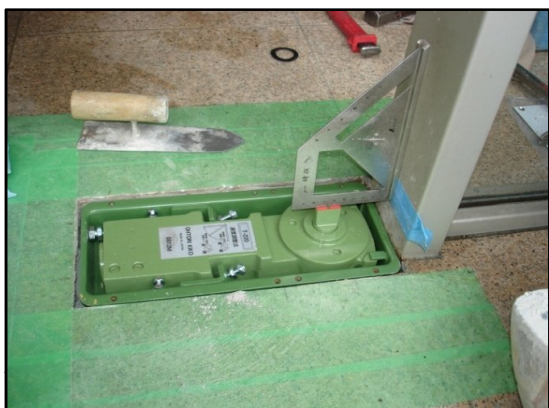
溶接前に扉の高さなどを測定中