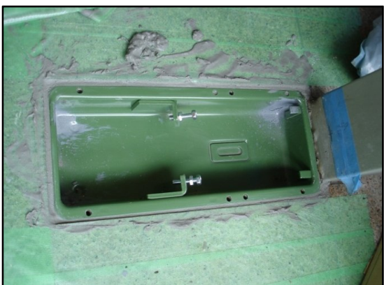
速乾性のモルタルで回りを固める。