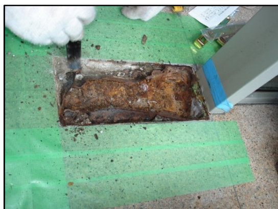
セメント箱のハツリ撤去作業