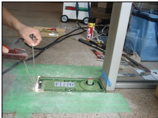
溶接で前後左右4ヶ所固定中