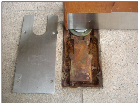
フロアヒンジ交換前