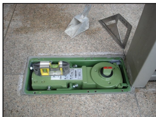
フロアヒンジ本体の傾斜を測定中